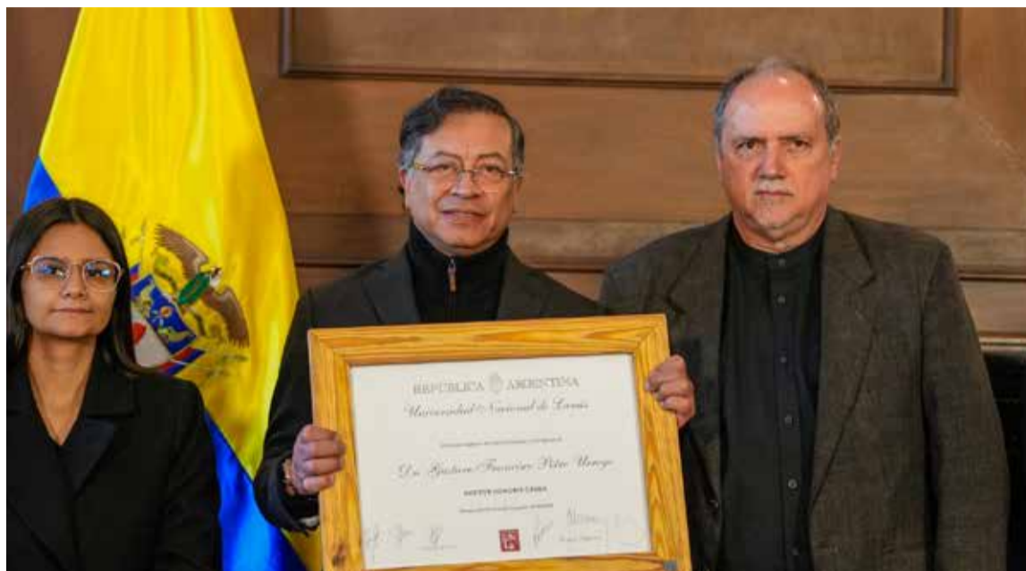
El presidente de Colombia, Gustavo Petro, recibiendo el título de Doctor Honoris Causa de la Universidad Nacional de Lanús en Argentina. Se le ve en el estrado, junto a las directivas de la institución, durante la ceremonia de entrega de la máxima distinción académica.

«No precisamente !! las cifras muestran algo distinto. Casi el 70% del nuevo empleo viene de «trabajador