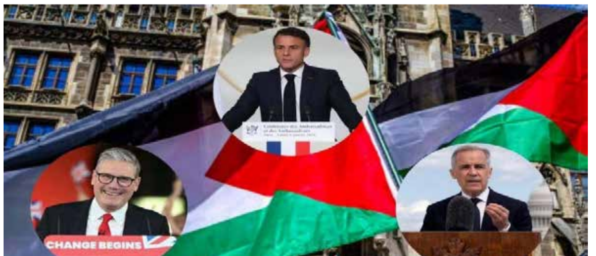
Estados que se pronuncian en contra del genocidio de Israel con el pueblo palestino.

Desde el 29 de noviembre de 2012, el Estado de Palestina ostenta el estatus de «Estado observador no miembro» en la Asamblea General de las Naciones Unidas, concedido mediante la Resolu-