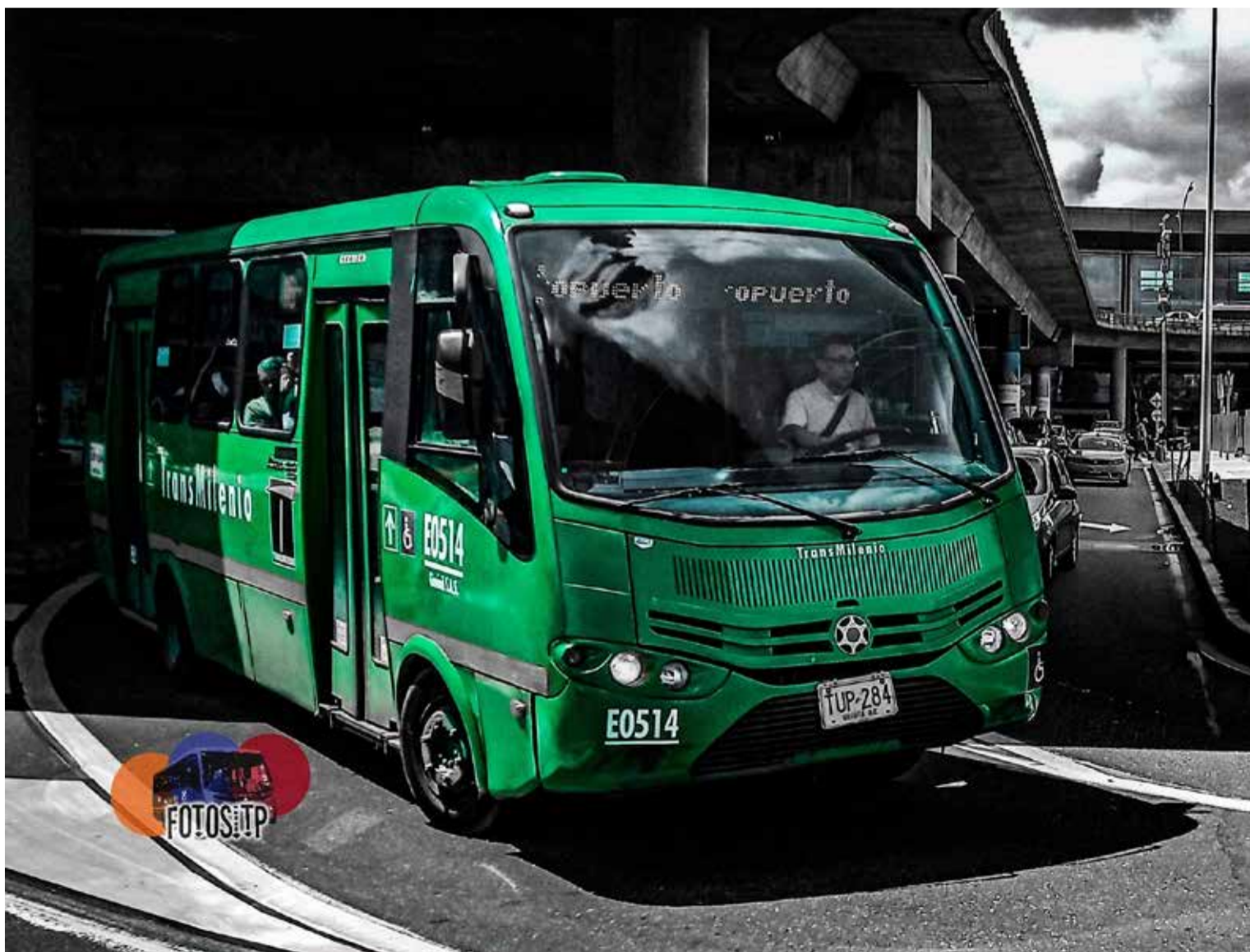
Las viejas busetas aún transportan viajeros en Bogotá, pues el sistema TransMilenio no llega directamente a El Dorado. Esto, sumado a la lejanía del Portal El Dorado y las tarifas elevadas de los taxis, complica el acceso al aeropuerto.

Pasajeros: En 2024, Heathrow superó récords al manejar 83.9 millones de pasajeros, y proyecta alcanzar los 84.2 millones en 2025, una cifra que subraya su rol como puerta de entrada trans-