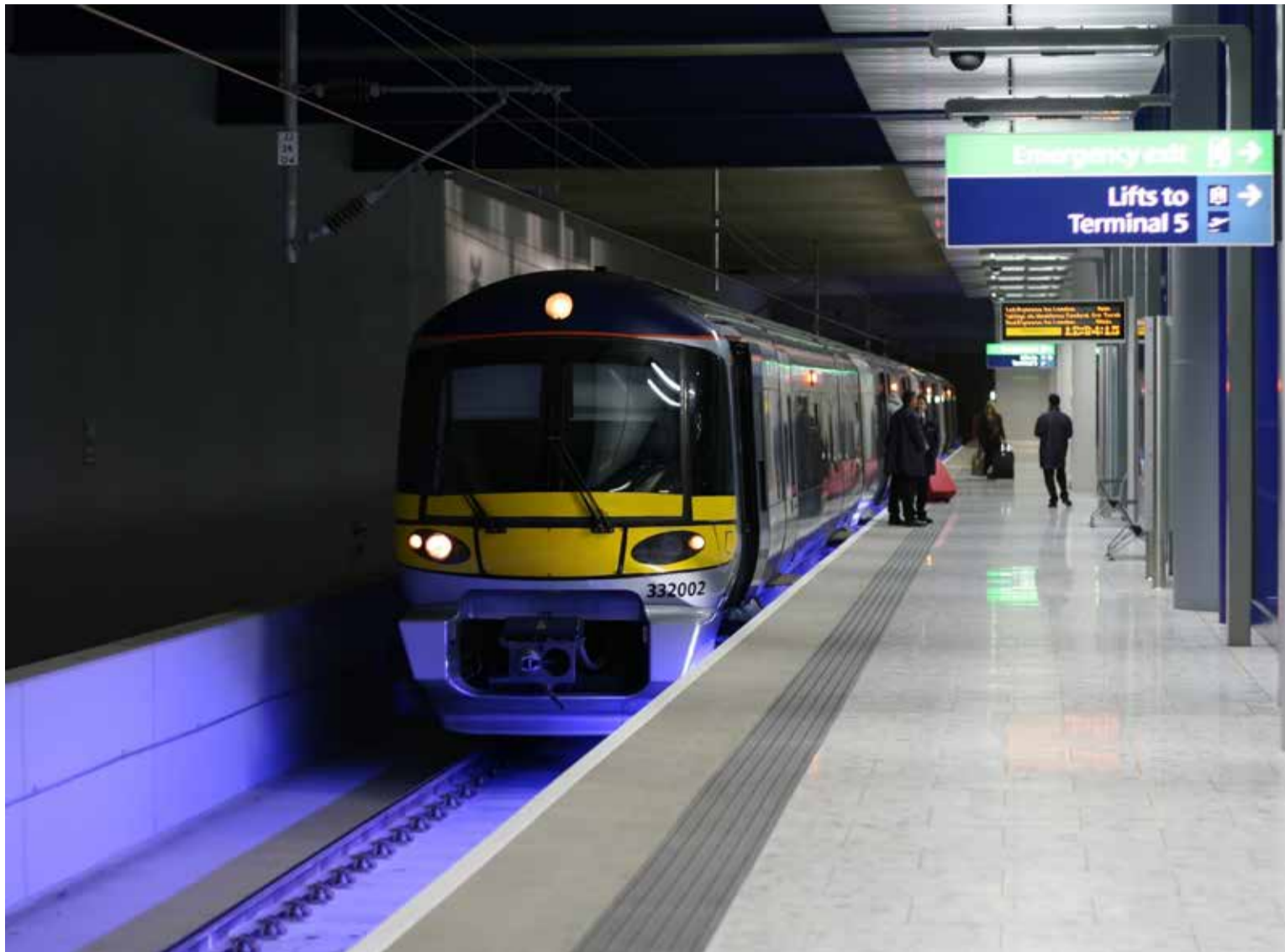
Cómodamente se llega al aeropuerto de Heathrow utilizando la línea Piccadilly del Metro de Londres. Además, la Elizabeth Line también ofrece un acceso directo y conveniente.

Londres, aprovechando la oportunidad de experimentar una de las obras más funcionales y dinámicas del planeta.