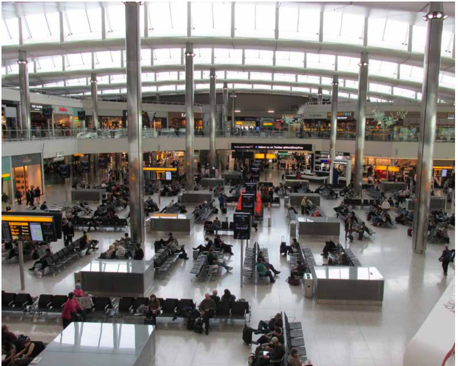
El Aeropuerto Heathrow en Londres ofrece varias salas VIP con gran comodidad, especialmente en la Terminal 2. Por ejemplo, la Plaza Premium Lounge en esta terminal cuenta con suites de descanso privadas y duchas.

El Dorado (BOG): Si bien es el aeropuerto más grande de Colombia y un líder en América Latina,