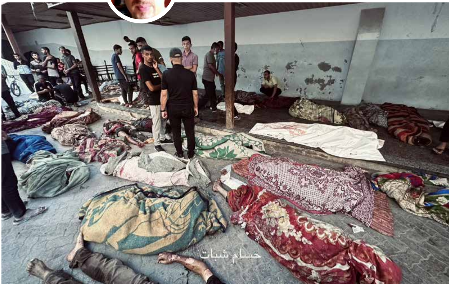
Masacre de Gaza

ción con fines políticos y económicos. Pues es evidente el ocultamiento de los datos y cifras reales de las víctimas en el enclave palestino, como además la precaria ayuda humanitaria y la violación sistemática de los protocolos mínimos, que Israel debe garantizar con la población afectada en territorio.