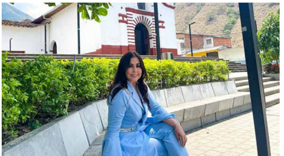
Con orgullo recorre los sitios que le recuerdan su inicio como cantante