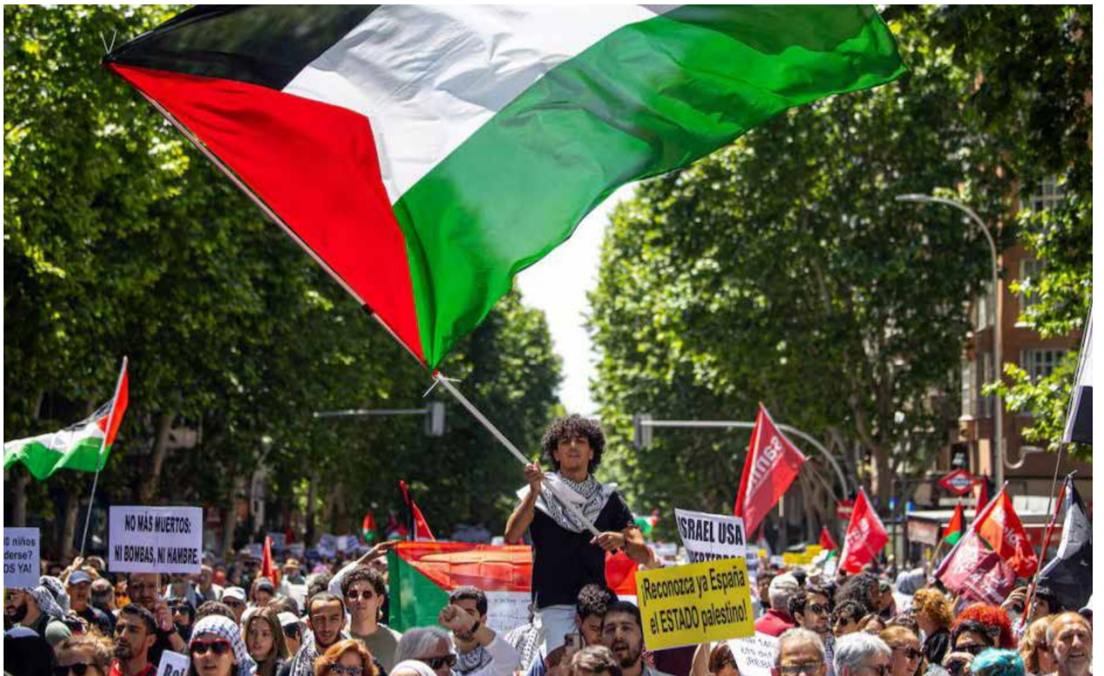
147 de los 193 estados miembros de la ONU ya reconocen un Estado palestino, que mantiene un estatus de observador en la organización.

La cifra de «147 de 193» es dinámica y refleja un apoyo global significativo a la autodeterminación palestina, aunque puede variar levemente según la fuente y los criterios de contabilización. La mayoría de estos reconocimientos se consolidaron tras la declaración de independencia palestina en 1988, provenientes principalmente de África, Asia, América Latina y Europa del Este. Cada nuevo reconocimiento bilateral se percibe como un paso diplomático crucial que legitima las aspiraciones palestinas, aunque no confiere automáticamente la membresía plena en la ONU ni una soberanía