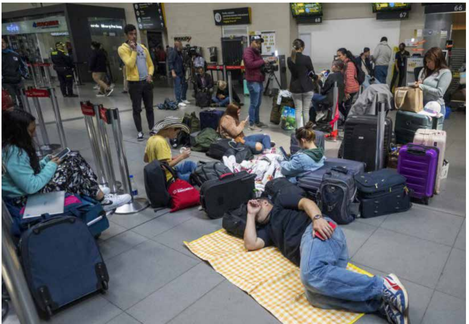
En las salas de espera del aeropuerto El Dorado de Bogotá, la mayoría carece de asientos suficientes. Esto dificulta ofrecer un servicio adecuado a todos los pasajeros.