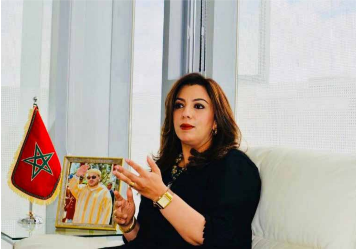
La Embajadora del Reino de Marruecos en Colombia y Ecuador, Farida Loudaya

deportivos y musicales que realzan la riqueza del patrimonio marroquí. Conciertos, exposiciones de arte, festivales de folclore y competiciones deportivas se suman a la celebración, fomentando la participación ciudadana y el disfrute colectivo.