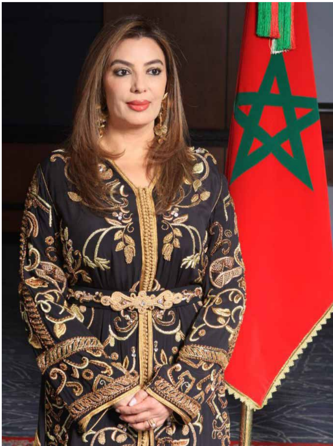
Embajadora del Reino de Marruecos en Colombia y Ecuador, Farida Loudaya