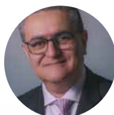
Hernán Alejandro Olano García

En suma, la Ley 2494 de 2025 no es una mera regulación técnica; es una medida de higiene democrática. Reconoce que, en el siglo XXI, el poder de las encuestas no está solo en su capacidad predictiva, sino en su influencia simbólica y narrativa. Al establecer estándares rigurosos, Colombia avanza hacia una democracia más informada, transparente y confiable, donde la opinión pública se mide con rigor científico y se comunica con responsabilidad ética. Esta ley es, en buena medida, un antídoto contra la manipulación disfrazada de estadística, pues como decía Nicolás Gómez Dávila: «La estadística es el instrumento de los que quieren transformar el capricho de la mayoría en sabiduría objetiva», o, «La estadística es la mitología de la democracia». Así que, una ley que defiende no solo datos, sino la integridad del proceso electoral y la soberanía del votante reemplaza el escolio gomezdaviliano de que «Nada más falaz que una cifra obtenida con fines políticos».