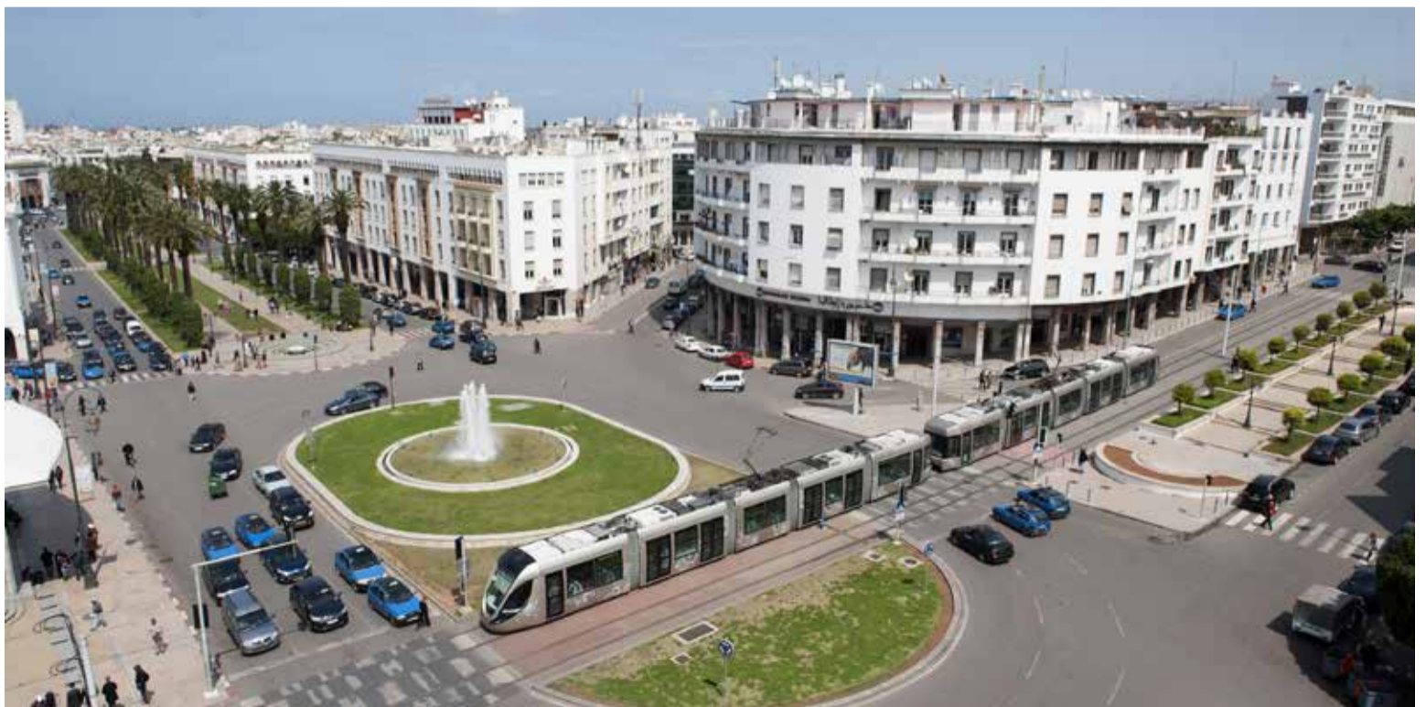
La Avenida Mohamed V es la principal arteria de Rabat, un vibrante eje que conecta la antigua medina con el corazón administrativo y moderno de la capital marroquí. Es conocida por su arquitectura colonial francesa y alberga importantes edificios gubernamentales e históricos.