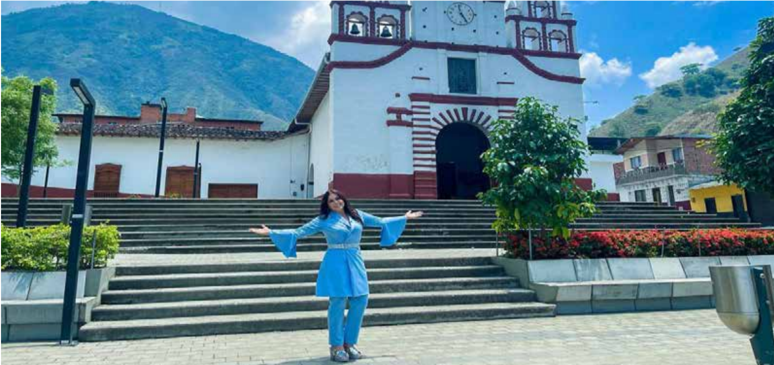
Que bonito pueblo de Arleys, con esos paisajes