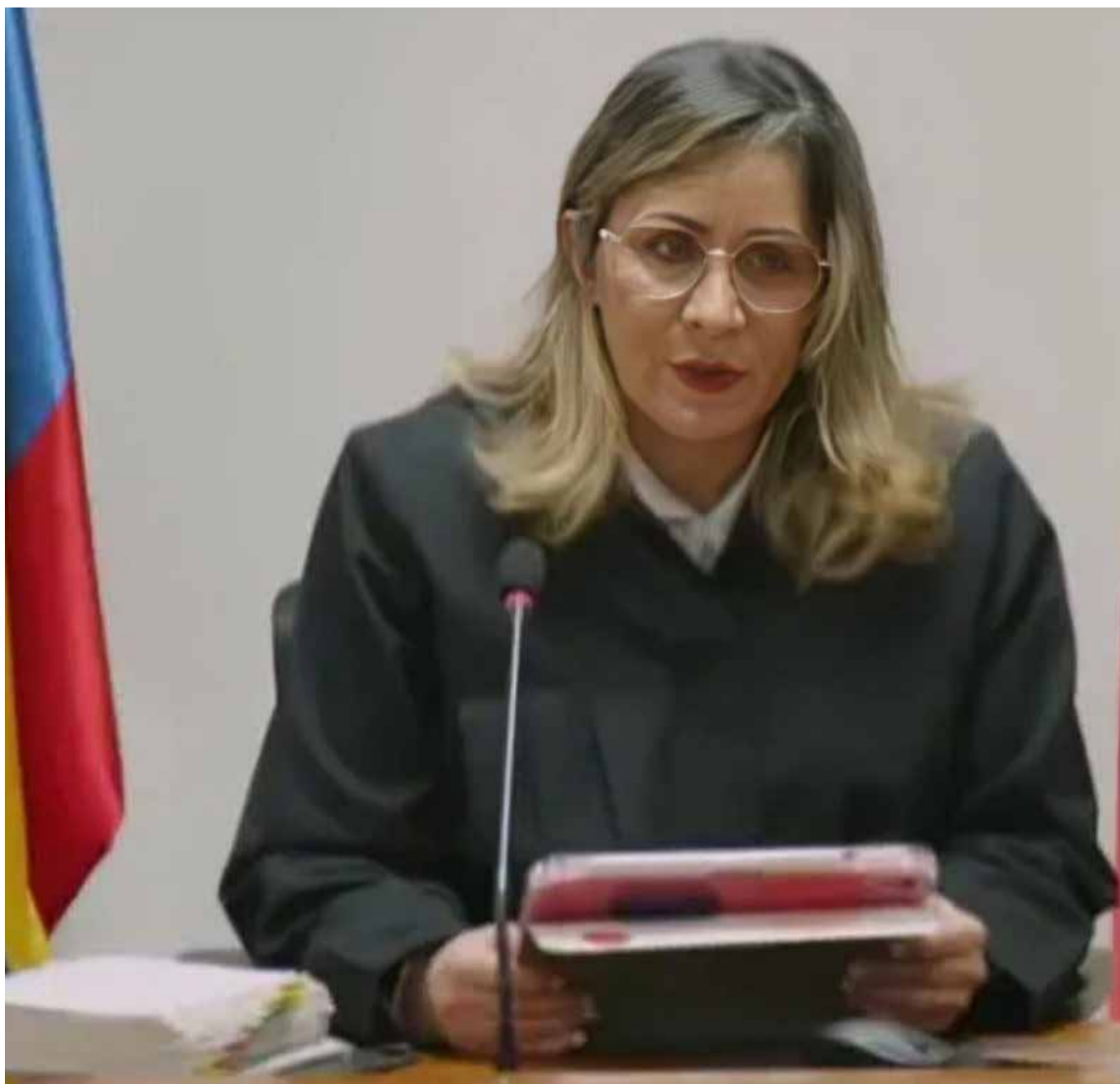
La jueza Sandra Heredia ha sido blanco de calumnias y amenazas por parte de políticos, empresarios y medios, quienes, con sus críticas, han demostrado un profundo desconocimiento del derecho.

quienes la administran. Enfatizó que los desacuerdos deben dirimir a través de los recursos legales, como la apelación que la defensa de Uribe presentará el próximo 11 de agosto, y no a través de una campaña mediática que atenta contra el debido proceso.